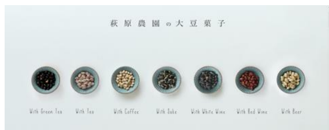
写真：株式会社萩原農園が販売する大豆菓子